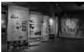
Blick in den Bereich „Griechische Jahre“ in der Ausstellung „Renato Mordo!“ in der Gedenkstätte KZ Osthofen

Ort: Gedenkstätte KZ Osthofen, Ziegelhüttenweg 38, 67574 Osthofen