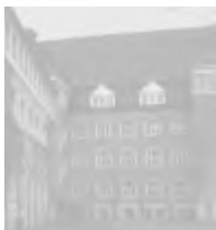
Goetheschule, Scheffelstraße 2

Junge Menschen, die sich heute auf ihren Beruf als Erzieher/-in vorbereiten, wollen am 27. Januar 2021 mit einem „Gang der Erinnerung“ an die Verbrechen an jüdischen Menschen erinnern und mit einem Friedensgebet zu Verständigung und Toleranz aufrufen. An ausgewählten Standorten werden Zeitzeugenberichte mit Hinweisen auf die jeweiligen Ereignisse vorgetragen.