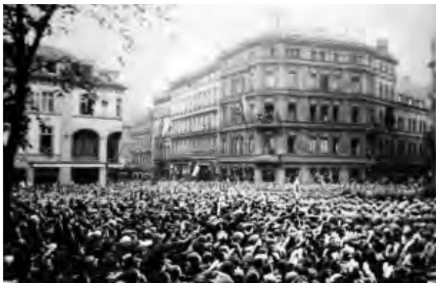
Blick auf den Schillerplatz anlässlich der Übergabe des Osterer Hofes als Mainzer „Braunes Haus“ an die NSDAP durch die Stadt Mainz am 23.04.1933

Veranstaltende: Verein für Sozialgeschichte Mainz e. V. und Institut für Geschichtliche Landeskunde an der Universität Mainz e. V.