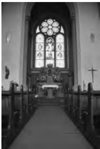
Klinikkirche St. Thomas

Rhein-Mosel-Fachklinik Andernach, Klinik-Kirche St. Thomas und Andernacher Spiegelcontainer an der Christuskirche