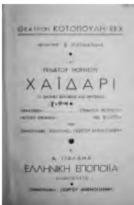
Erste Seite des Besetzungzettels zur Uraufführung