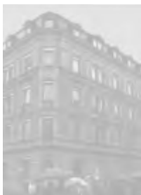
Ehemalige Gestapo-Zentrale, Kaiserstraße 31

Obwohl die Elisabeth-von-Thüringen-Schule ihren Standort verlegt hat, hält sie an der jährlichen Erinnerung fest und führt den „Weg des Gedenkens und der Besinnung“ in der Mainzer Neustadt durch.