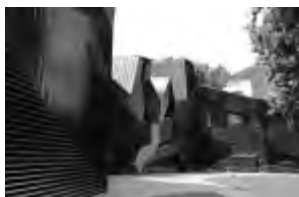
Innenhof der neuen Mainzer Synagoge