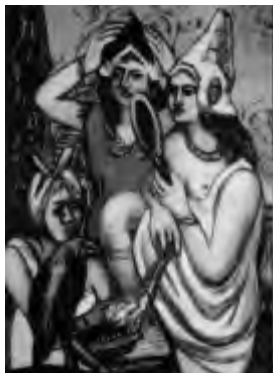
Max Beckmann, Vor dem Kostümfest, 1945

Landesmuseum Mainz, Große Bleiche 49 – 51, 55116 Mainz