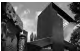
Die neue Synagoge in Mainz

Veranstalter: Deutsch-Israelische Gesellschaft (DIG), Arbeitsgemeinschaft Mainz, und Landes- zentrale für politische Bildung Rheinland-Pfalz