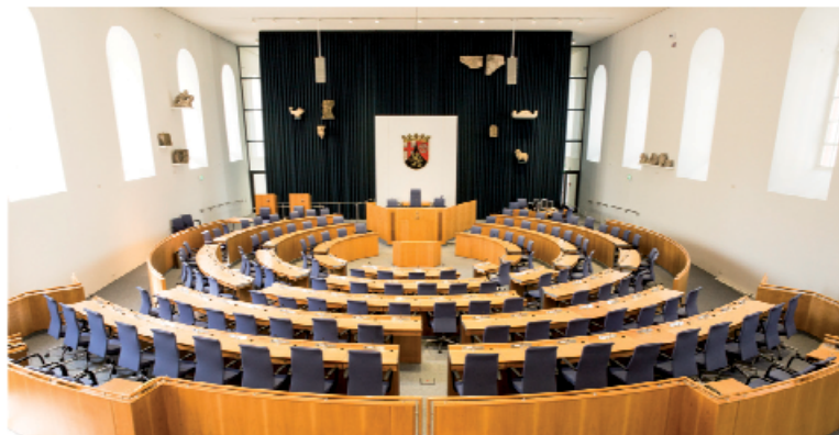
Der Interims-Plenarsaal des Landtags Rheinland-Pfalz in der Steinhalle des Landesmuseums Mainz während der Sanierung des Deutschhauses