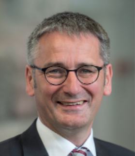
Hendrik Hering Präsident des Landtags Rheinland-Pfalz