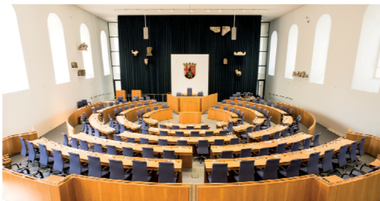
Der Interims-Plenarsaal des Landtags Rheinland-Pfalz in der Steinhalle des Landesmuseums Mainz während der Sanierung des Deutschhauses