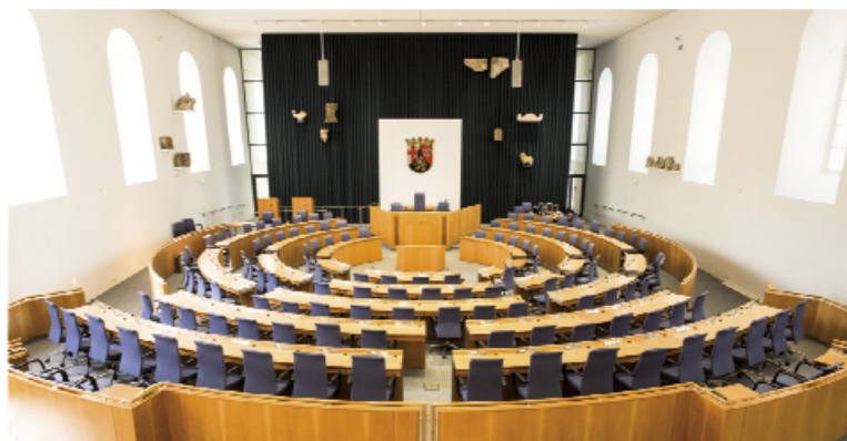
Der Interims-Plenarsaal des Landtags Rheinland-Pfalz in der Steinhalle des Landesmuseums Mainz während der Sanierung des Deutschhauses

Einführung: Hendrik Hering Präsident des Landtags