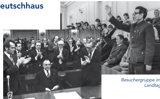
Besucherguppe im Landtag

Mittwoch, 4. November bis Freitag, 27. November 2015 Eröffnung: 19.30 Uhr