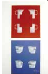
Rolf Barth Intensität durch Form und Farbe

Kunst im Landtag, Foyer des Abgeordnetenhauses